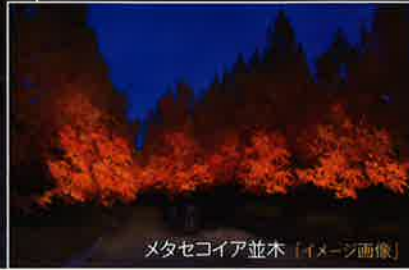
メタセコイア並木 「イメージ画像」