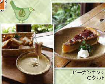
ミニカマンベールフォンデュ

※ドリンク100円割引チケット 1枚につきお一人様利用可 ドリンク付セットメニューも 適用されます。