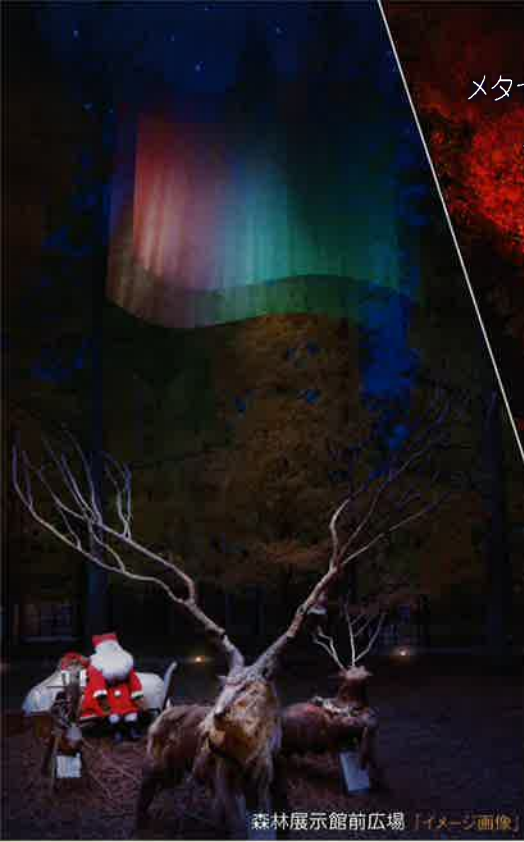
森林展示館前広場 「イメージ画像」

メタセコイアの木立の中、あわてんぼうのサンタクロースの上にオーロラが出現します。 メタセコイア並木やあじさい坂の紅葉のライトアップもあわせてお楽しみください。