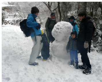
大雪の時は、でっかい雪だるま