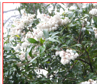
春には樹の花が咲きます