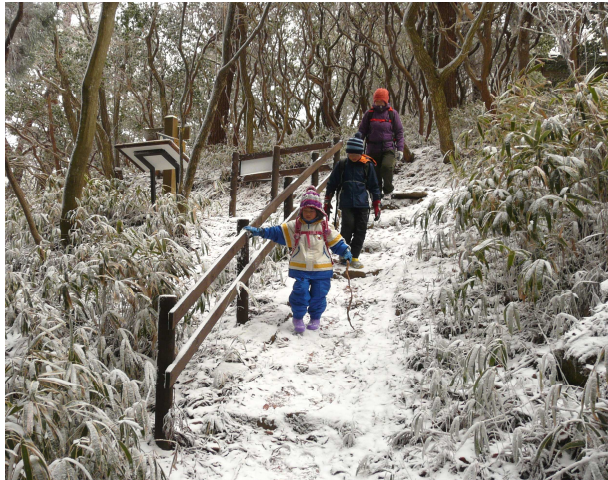
冬には雪や氷、凍った池が楽しめます