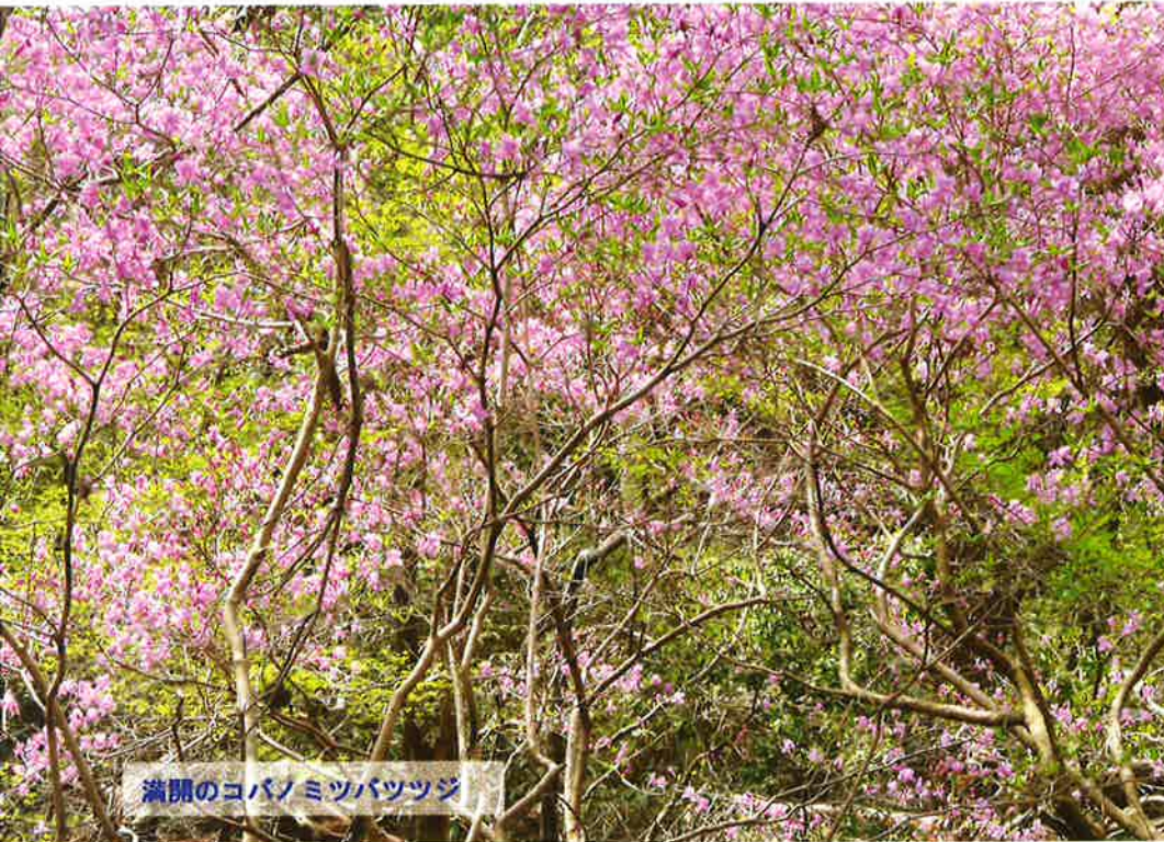
満開のコバノミツバツツジ