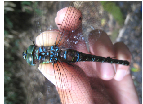
珍しいオオルリボシヤンマ

ルリ色に輝く美しい大型の「オオルリボシヤンマ」を探します。二つ池の水生生物も調べましょう