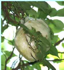
モリアオガエルの卵塊

そこにはモリアオガエルがたくさん棲んでいます。池のそばの樹木にソフトボールの大きさの真っ白な卵塊を産み付けるという珍しい繁殖をします。今年はどうくらい多いか、みんなで調べてみましょう。