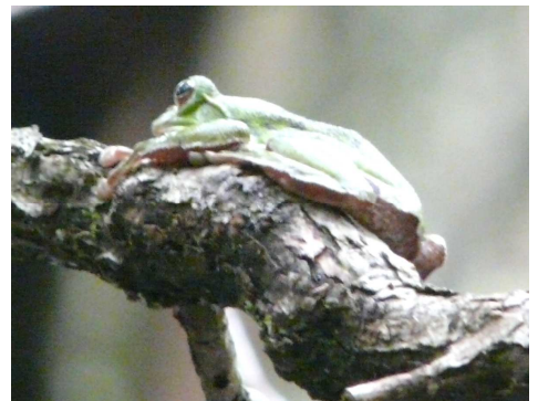
木に登っていくモリアオガエル