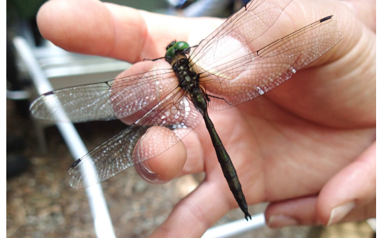
ルリボシヤンマをつかまえた！