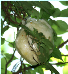
モリアオガエルの卵塊

そこにはモリアオガエルがたくさん棲んでいます。池のそばの樹木にソフトボールの大きさの真っ白な卵塊を産み付けるという珍しい繁殖をします。今年ほどたくさん多いか、みんなで調べてみましょう。