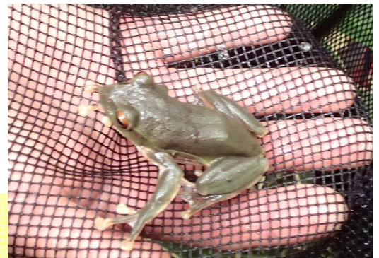
小さなモリアオガエル