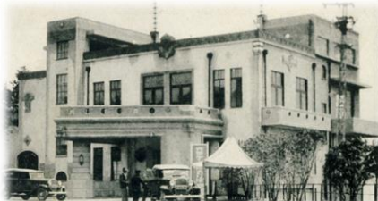
六甲ケーブル山上駅