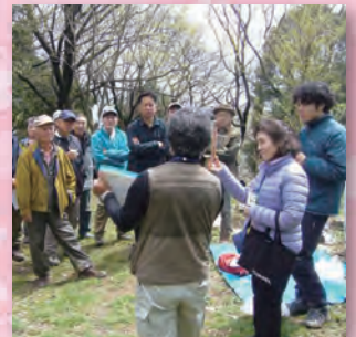
判り易くて楽しい自然観察会