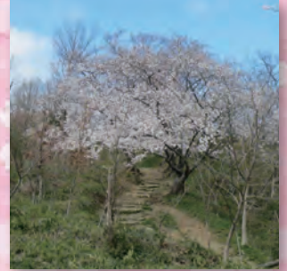
金鳥山に向う登山道沿いのサクラ