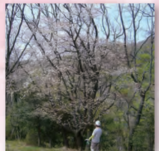
満開のヤマザクラ

「この地図は、国土地理院長の承認を得て、同院発行の数値地図 25000 (地図画像) を複製したものである。(承認番号 平 30 情複、第 986 号)」 「承認を得て作成した複製品を第三者がさらに複製する場合には、国土地理院の長の承認を得なければならない。」