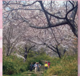
金鳥山付近の桜のトンネル