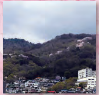
本山南町から望む岡本桜回廊