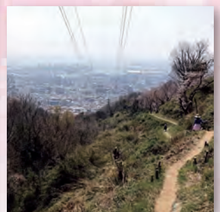
葉大尾根からの眺望

このチラシは「緑の募金」を活用した「森と緑とのふれあい支援事業」(兵庫県緑化推進協会)の助成金により作成しました。