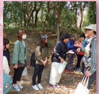
楽しい自然観察会