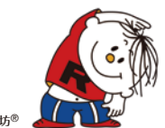
ラジオ体操イメージキャラクター ラタ坊®