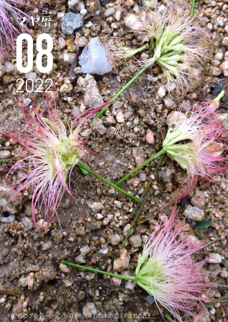
紅色のグラデーションが目を引くネムの木の花(子どもの丘)