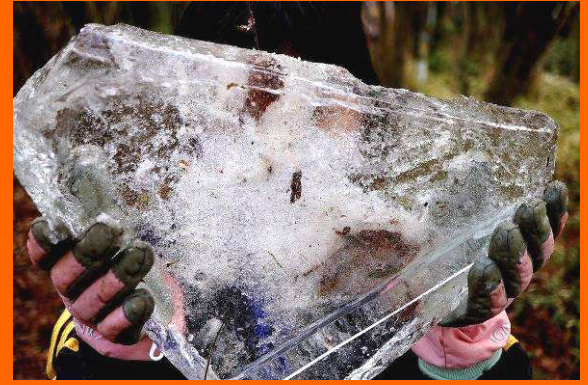
氷の厚さは5cmあるよ