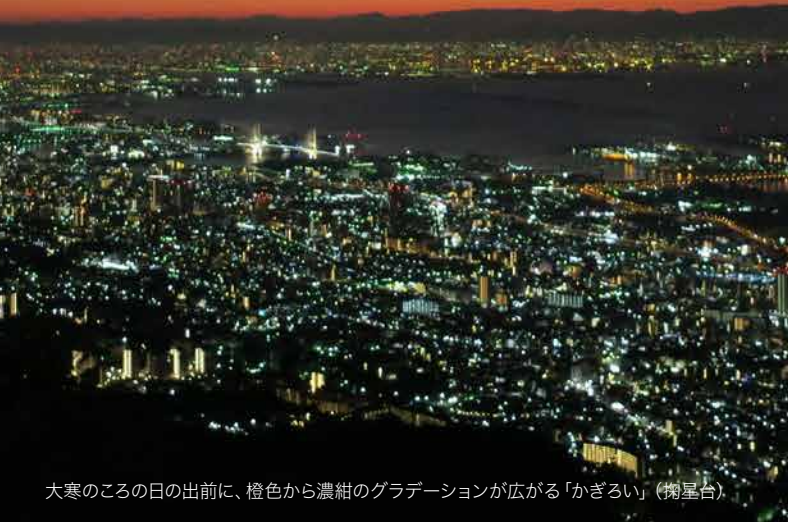
大寒のころの日の出前に、橙色から濃紺のグラデーションが広がる「かぎろい」(掬星台)。