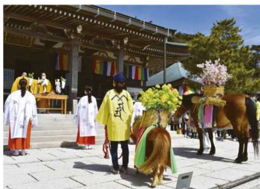
御馬詣(天上寺 金堂前にて)

平成七年阪神淡路大震災で中断。平成十四年に「摩耶山の春の山開き」を兼ねた行事として「摩耶詣祭」を復活させ、今日にいたっています。(当節の事情を考慮して、旧暦二月の初午の日に限定せず、今年三月二十五日(土)に執り行います)