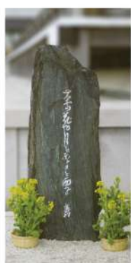
蕪村の菜の花の句碑(天上寺境内)

— 菜の花や月は東に日は西に — 菜の花と摩耶山とはことのほか ゆかりが深い。菜の花は灘区の 「歴史の花」です。