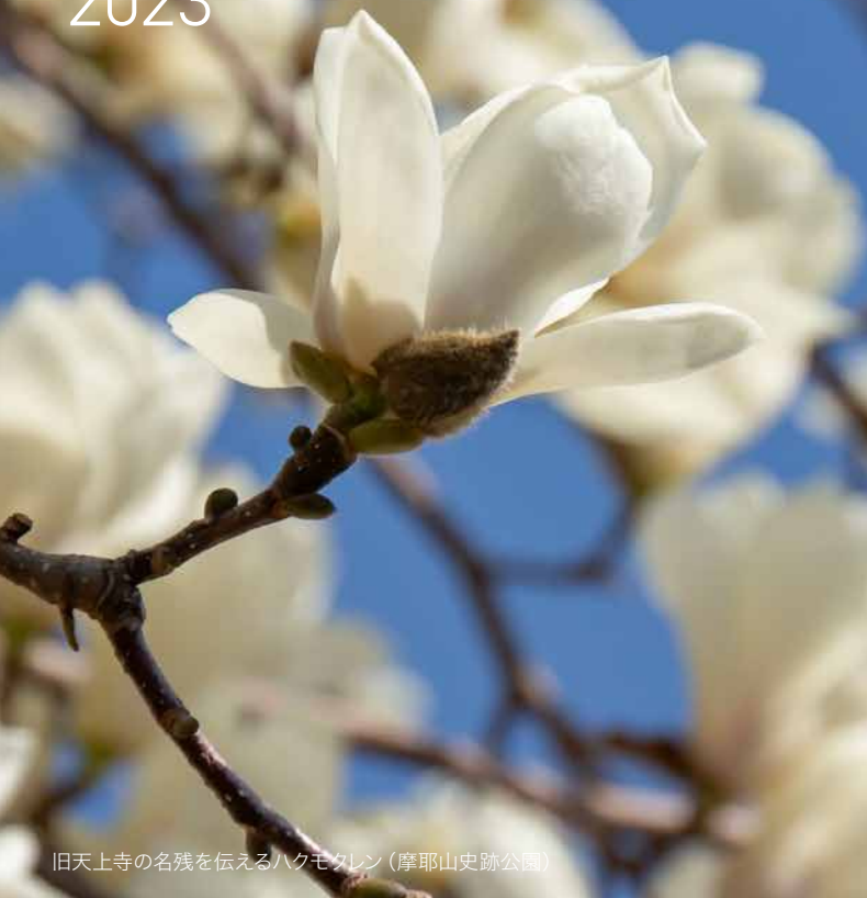
旧天上寺の名残を伝えるハクモクレン（摩耶山史跡公園）