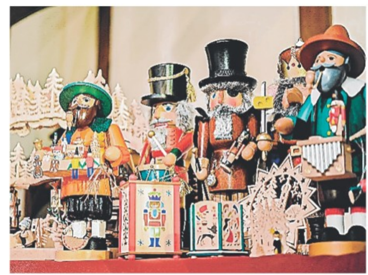
ドイツの伝統工芸品の人形など

ゴールを販売する。併設の森のCaféでは「森のCaféクリスマスフェア」と題し、「シュトレン」や「ラクレットチーズプレート」などドイツのクリスマスおなじみのメニューを提供する。