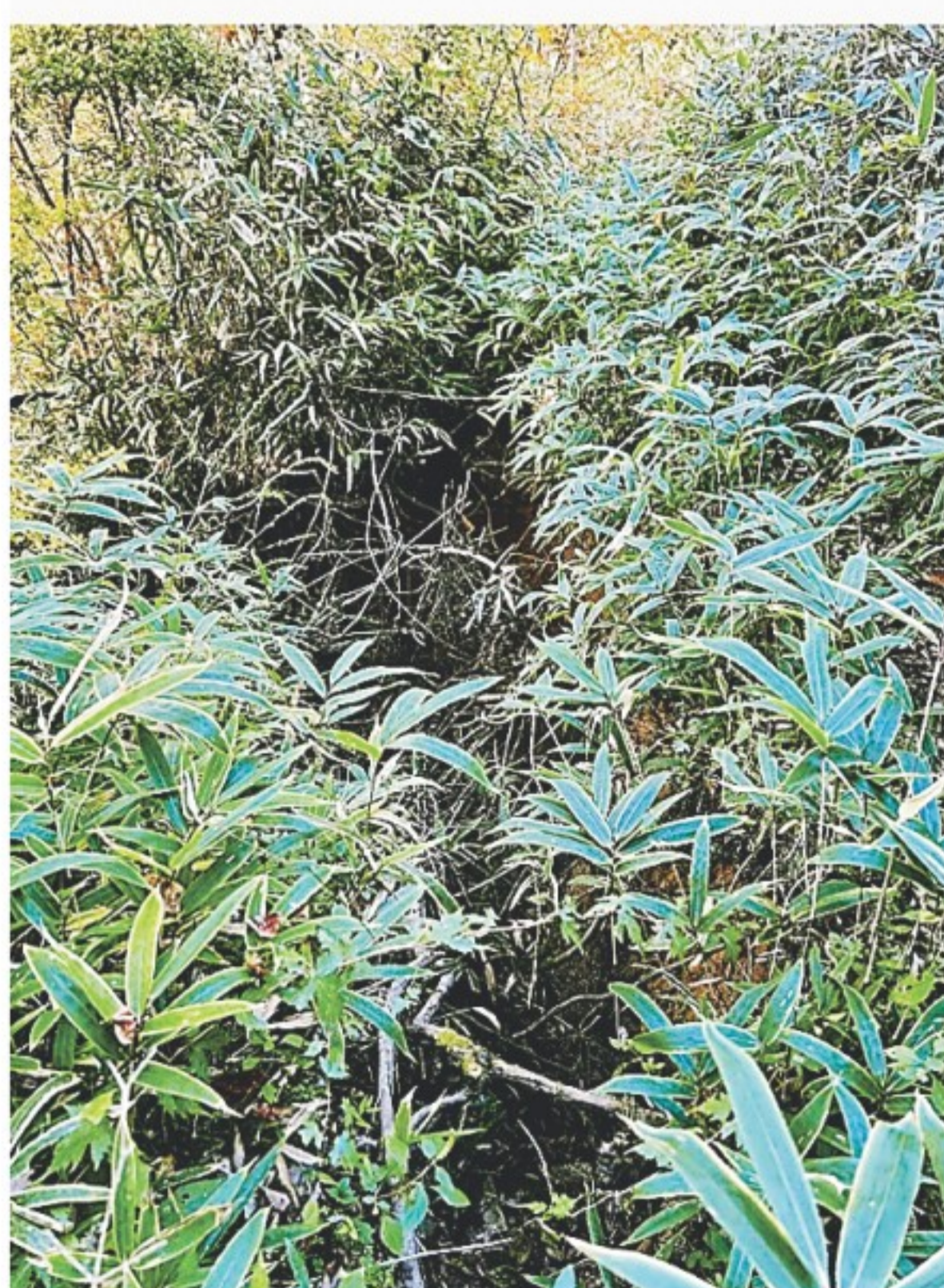
いきなり足元が滑れている箇所あり