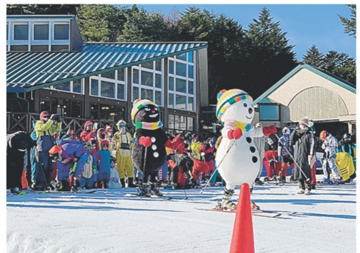
昨年のオープンの様子

雪遊びエリア「スノーランド」では、こたつに入ったまま雪上を滑れる「ソリこたつ」が登場。「こたつで温まりながら雪遊びを楽しみたい」との願いをかなえる斬新な企画だ。また、筋肉質な体