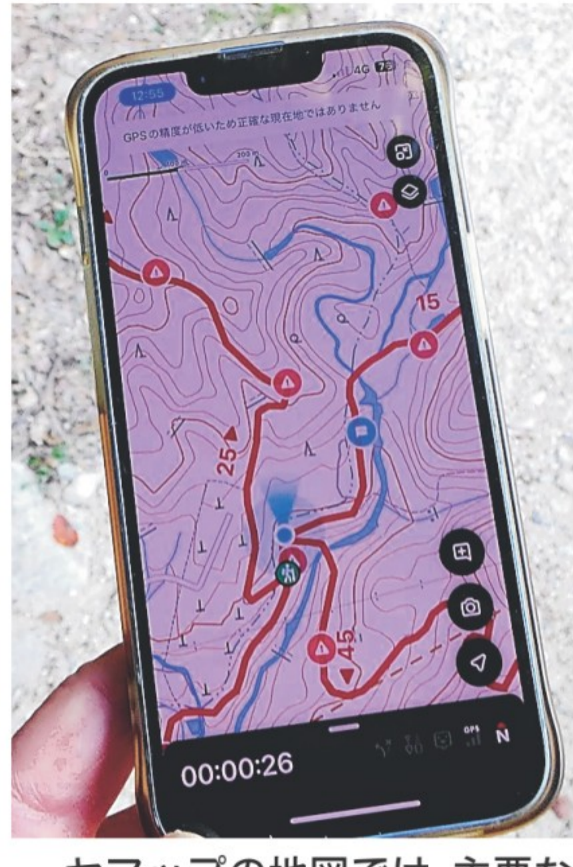
ヤママップの地図では、主要な登山道と現在地が表示される