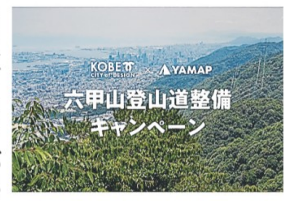
六甲山登山道整備キャンペーンのトップページ

◆圧巻!!大龍寺周辺の紅葉。見に行こう 12月9日9時半、諏訪山児童公園集合(市バス「諏訪山公園下」下車)。諏訪山児童公園一金星台一諏訪神社一大師道一大龍寺一市ケ原一新神戸駅までのコース。諏訪神社から大龍寺までの大師道と呼ばれる山道では、12月上旬にイロハモミジなどの紅葉を見ることができ、まさに圧巻の景観＝写真。後半は、布引貯水池や布引の滝を見ながら新神戸駅まで下る。講師は六甲山自然案内人の会のメンバー。弁当、飲み物、雨具など持参。参加費300円。予約不要。小雨決行。六甲山自然案内人の会☎090・1595・2397 (19~21時)