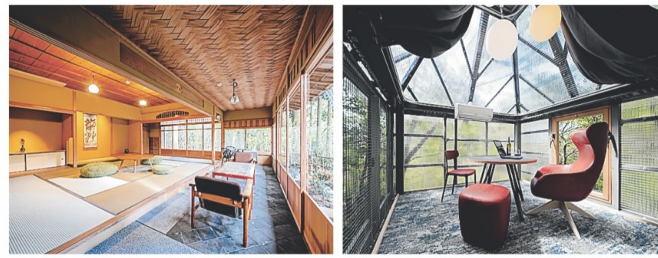
「Showin 書院」の内部 コテージの内部