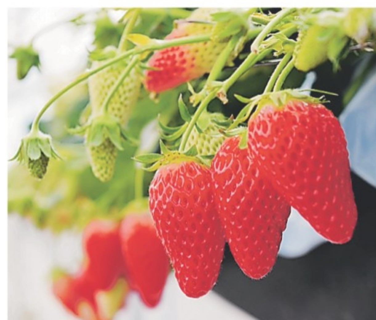
神戸の農園で味わえるイチゴ

シーズンは6月上旬まで。いずれも事前予約制で、入園時間は農園ごとに異なり30～45分。中学生