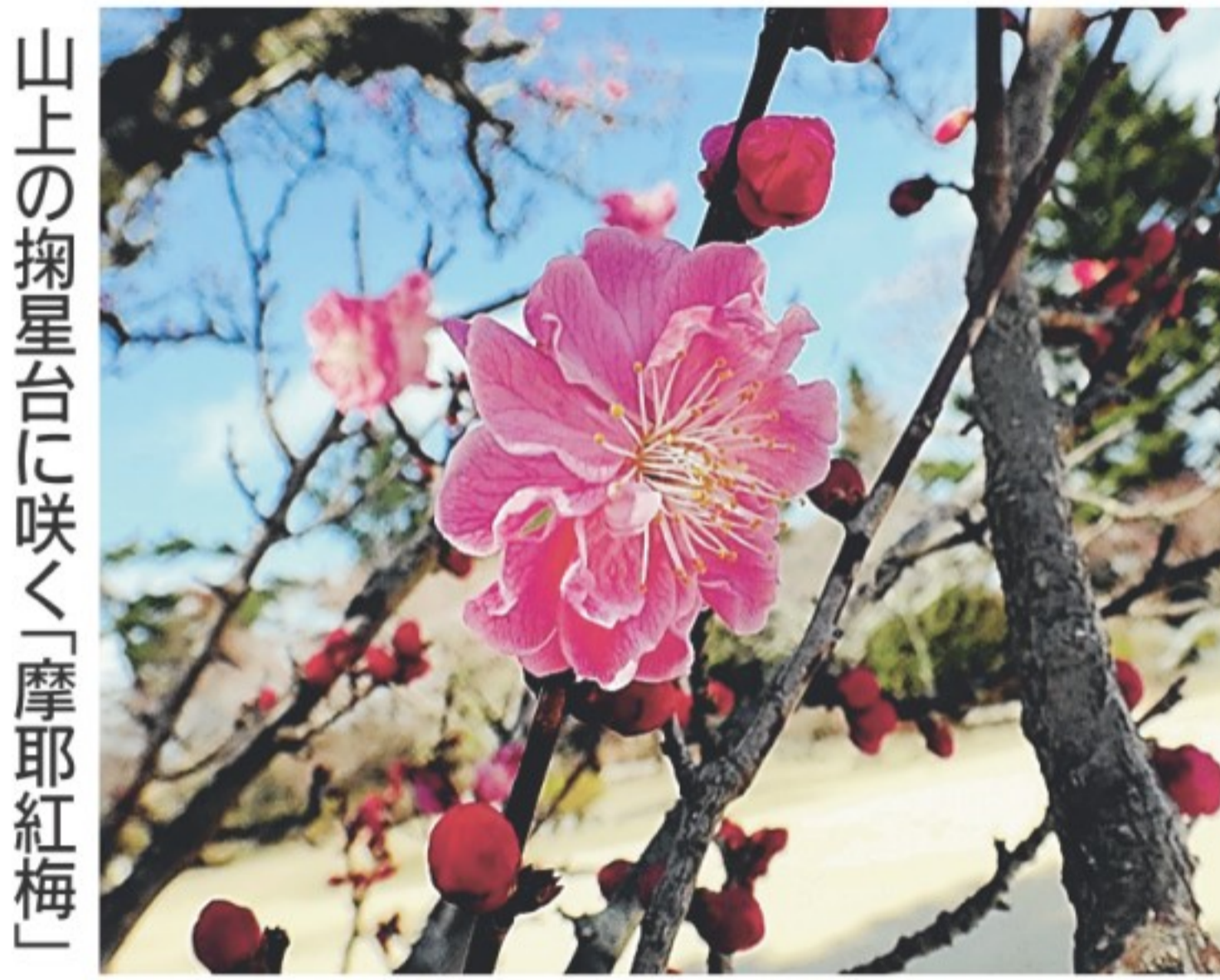
山上の掬星台に咲く「摩耶紅梅」

ところで、マヤカツの参加者をはじめ、摩耶山に気軽に上りたい人たちの心強い味方が、まやビューラインサポーターの会(制度なし)の制度だ。山上への運賃は、大人ならケーブルとロープウェイを合わせて片道900円、往復1800円。