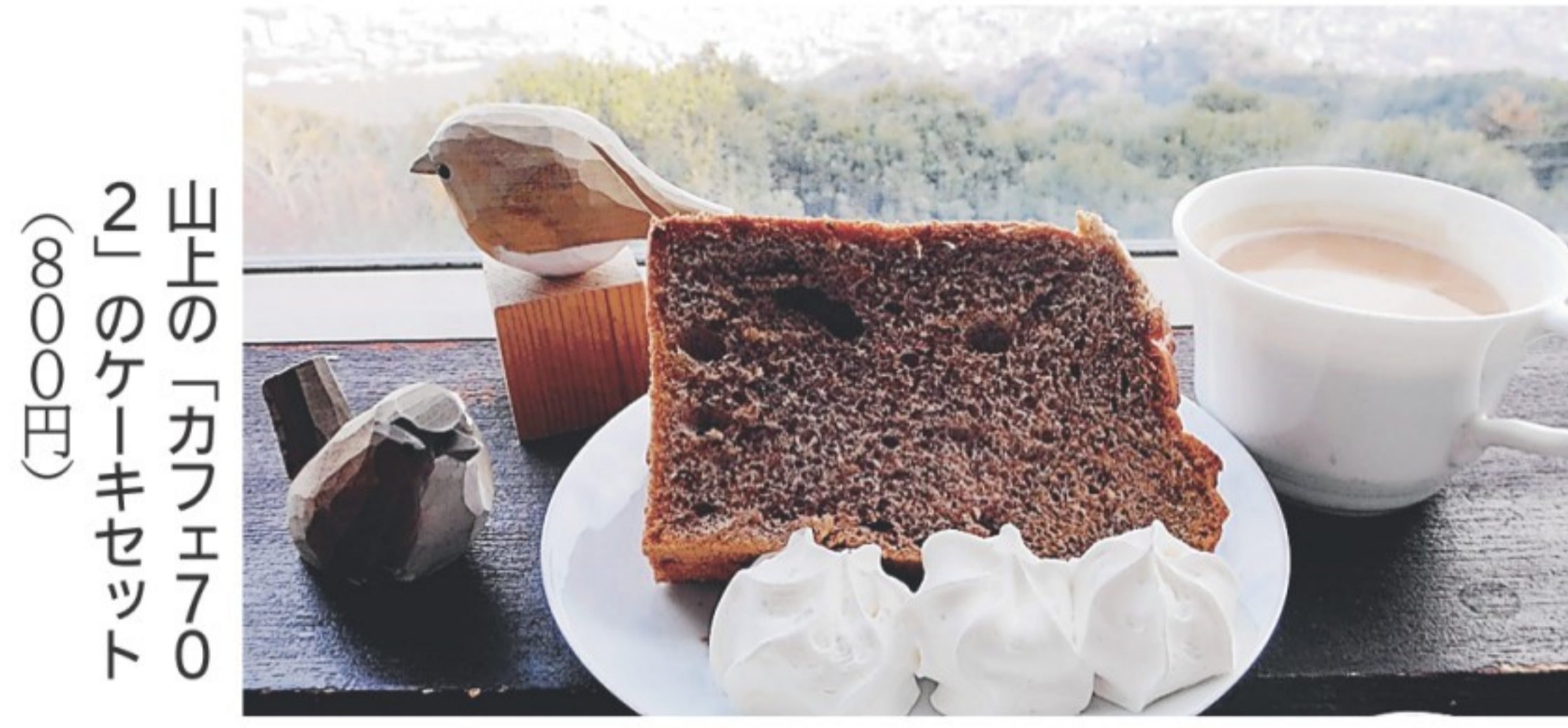
山上の「カフェ70」のケーキセット(800円)

標高約700mの摩耶山(神戸市灘区)は、まやビューライン(ケーブルとロープウェイ)で山麓と結ばれている。自然豊かな山頂でありながら気軽に上る。絶景を楽しめる展望台やカフェもある。コカや手芸、語学、音楽、料理など盛りだくさんな内容がある大人の部活「マヤカツ」が開催され、いつもいろんな人でのびのびしている。冬場は例年、設備などの点検のため長く連休する。今冬は特に長く、3カ月以上も「冬眠」したが、ようやく目覚めるときが近づいてきた。27日から通常運転を再開し、30日には摩耶山の春山開きの伝統行事、摩耶詣祭が開催され、いよいよ春本番を迎える。