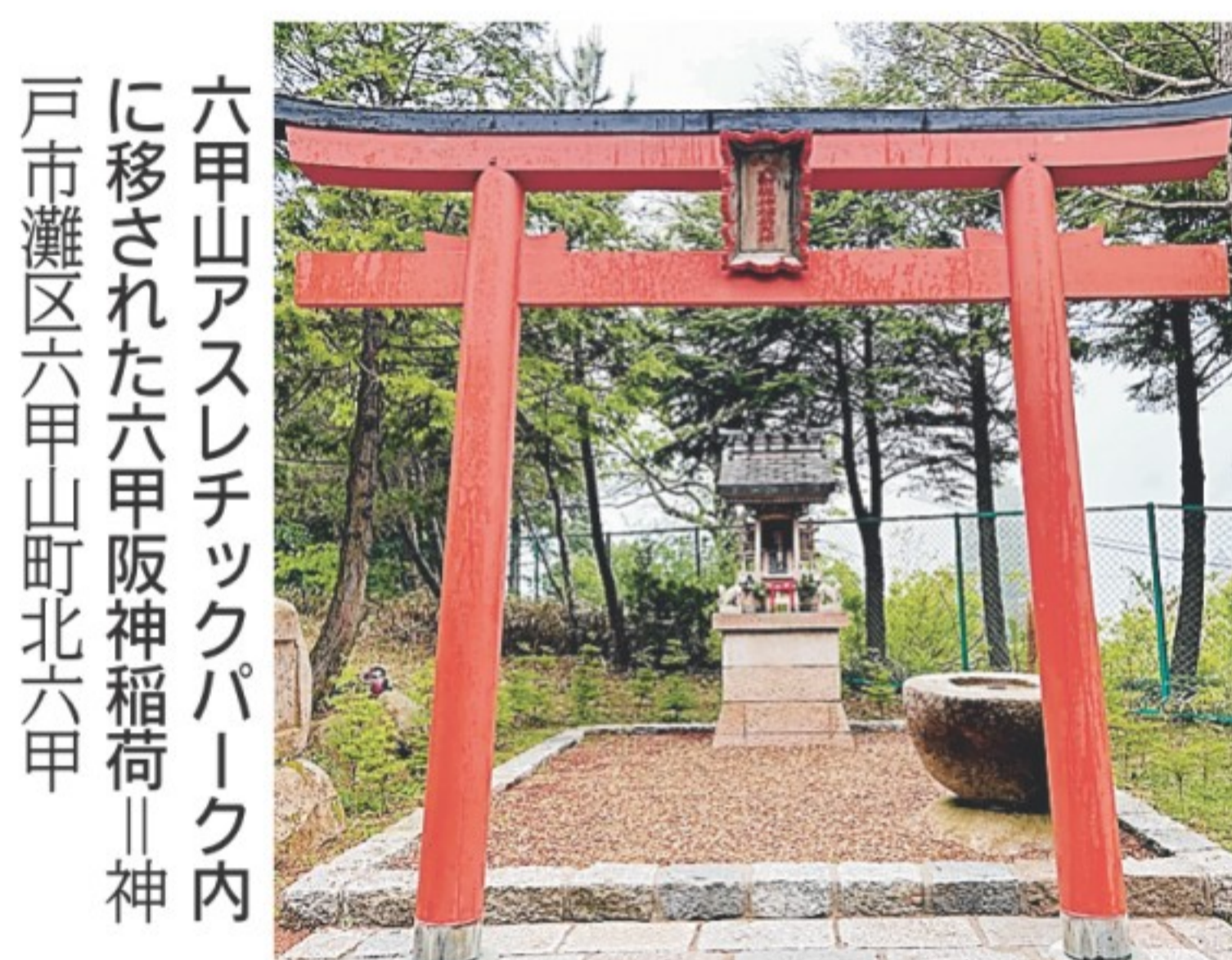
六甲山アスレチックパーク内に移された六甲阪神稲荷 神戸市灘区六甲山町北六甲

その両ロードが出合う地点が、山上を東西に貫く県道16号上にある「前ヶ辻」だ。一帯はこれまで歩道がなく、ハイカーにとって非常に危険で歩きにく