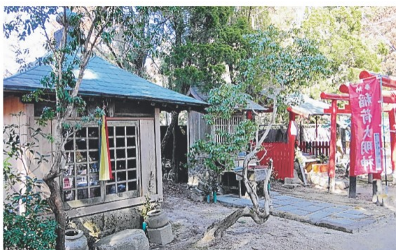
旧白髭神社＝神戸市灘区六甲山町南六甲

その両ロードが出合う地点が、山上を東西に貫く県道16号上にある「前ヶ辻」だ。一帯はこれまで歩道がなく、ハイカーにとって非常に危険で歩きにく