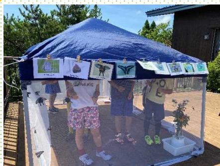
写真：展望デッキでみつやり体験