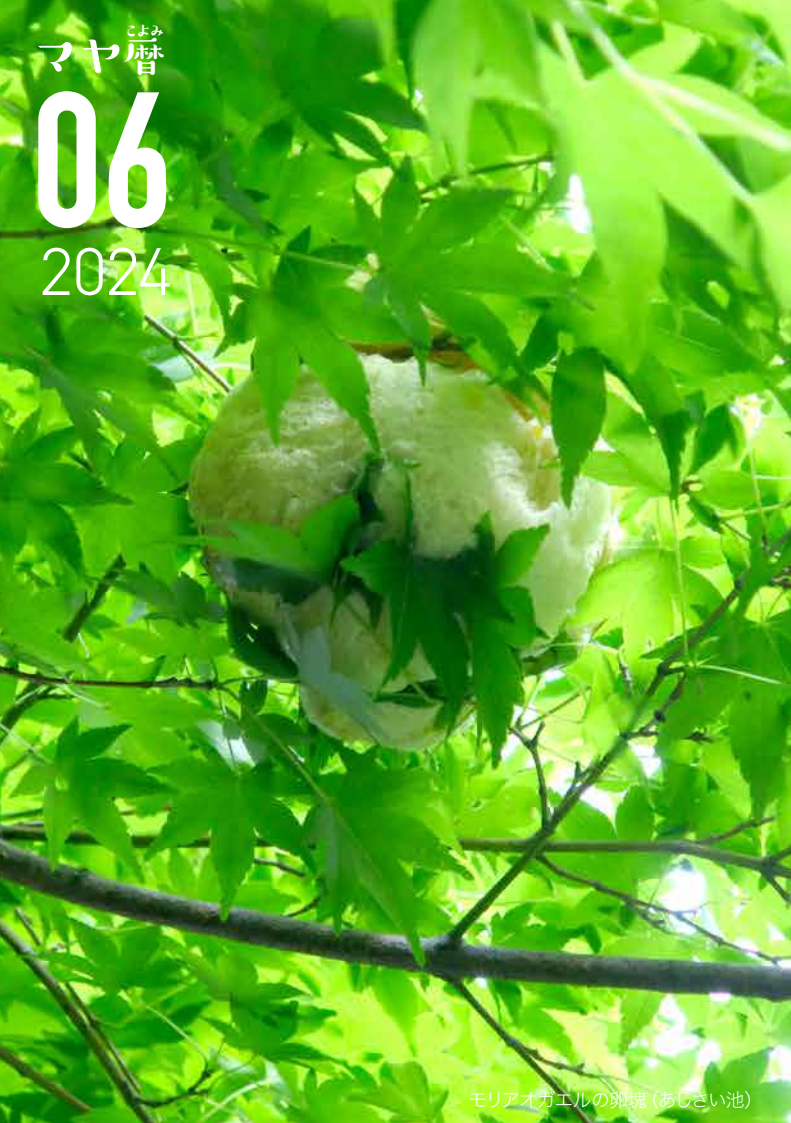
モリアオガエルの卵塊(あじさい池)