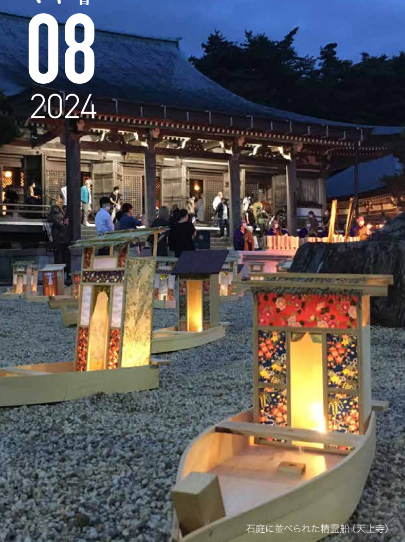
石庭に並べられた精霊船(天上寺)