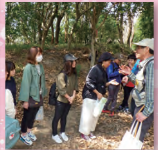
楽しい自然観察会