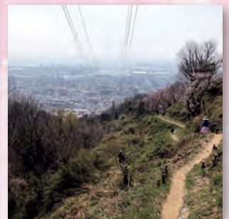
薬大尾根からの眺望

このチラシは2024年度(公財)コープともしびボランティア振興財団からの助成を受けて作成しています。