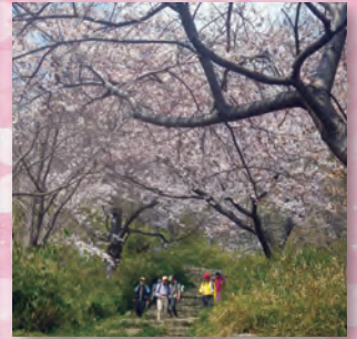
金鳥山付近の桜のトンネル