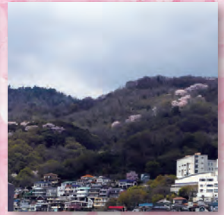
本山南町から望む岡本桜回廊