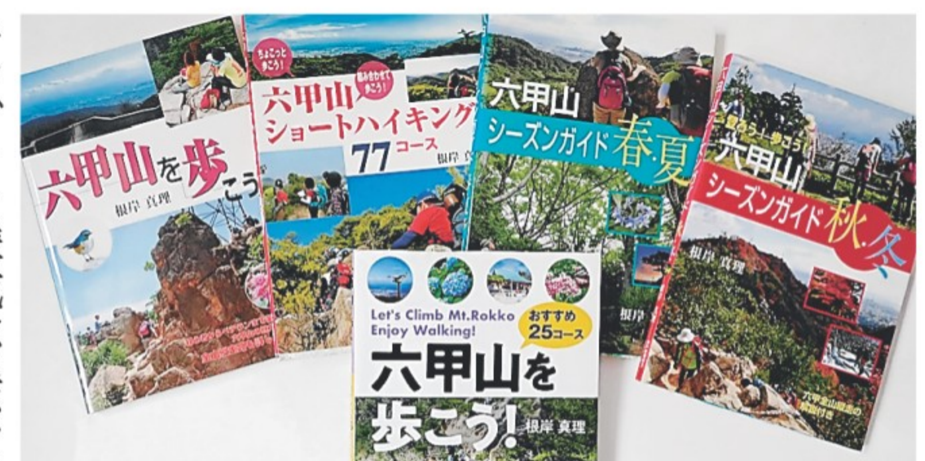
筆者が刊行したこれまでの六甲山関連の書籍