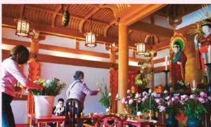
献花 —ご参拝の皆さまにも献花をしていただきます—