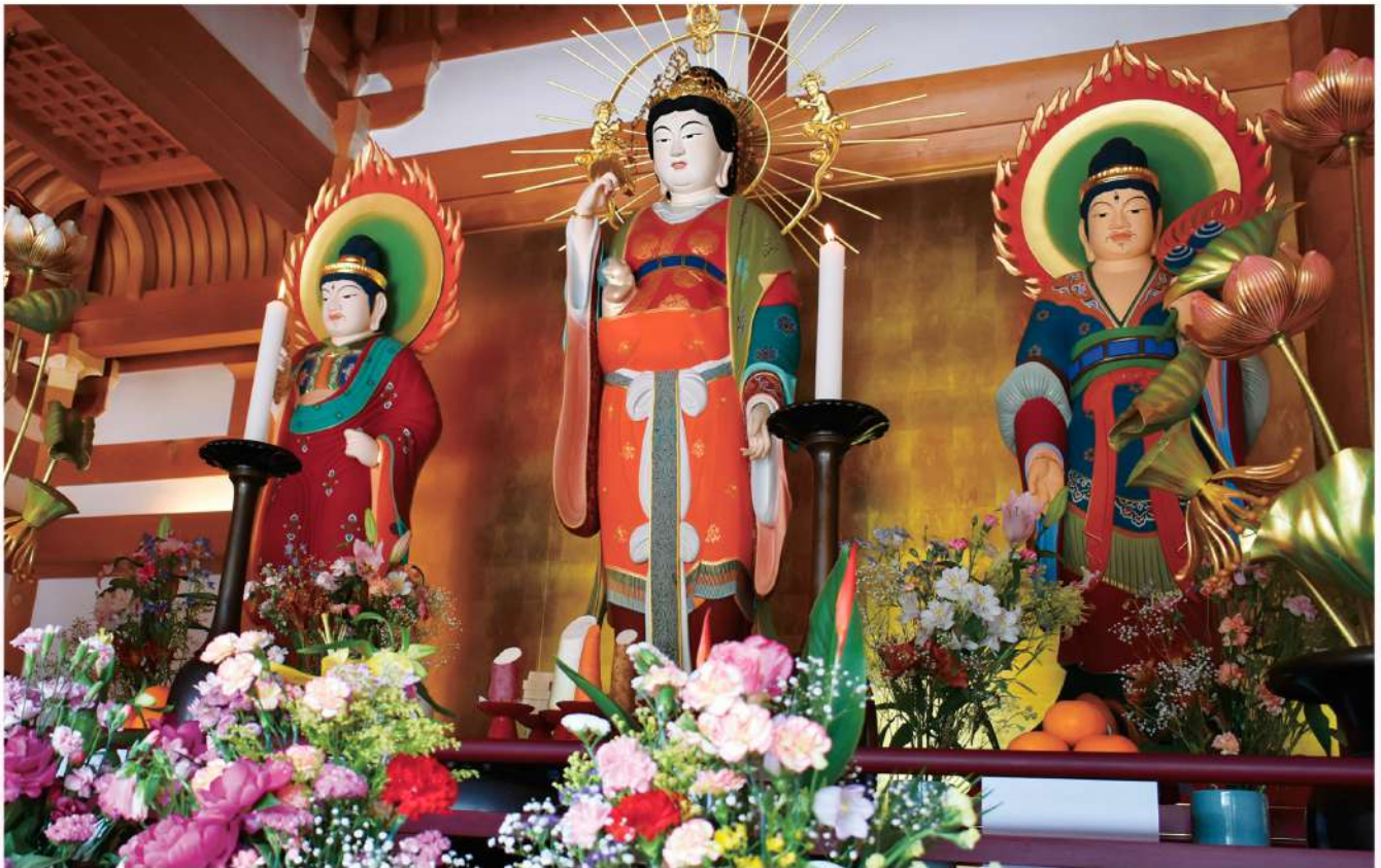
▲写真左から 帝釈天・摩耶夫人尊・梵天

摩耶山の《仏母忌・花供養》は、切利天に昇天して仏となられた摩耶夫人を讃嘆し、花々を捧げる法会です。