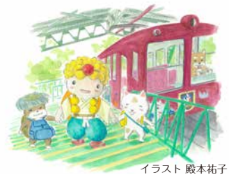
イラスト 殿本祐子