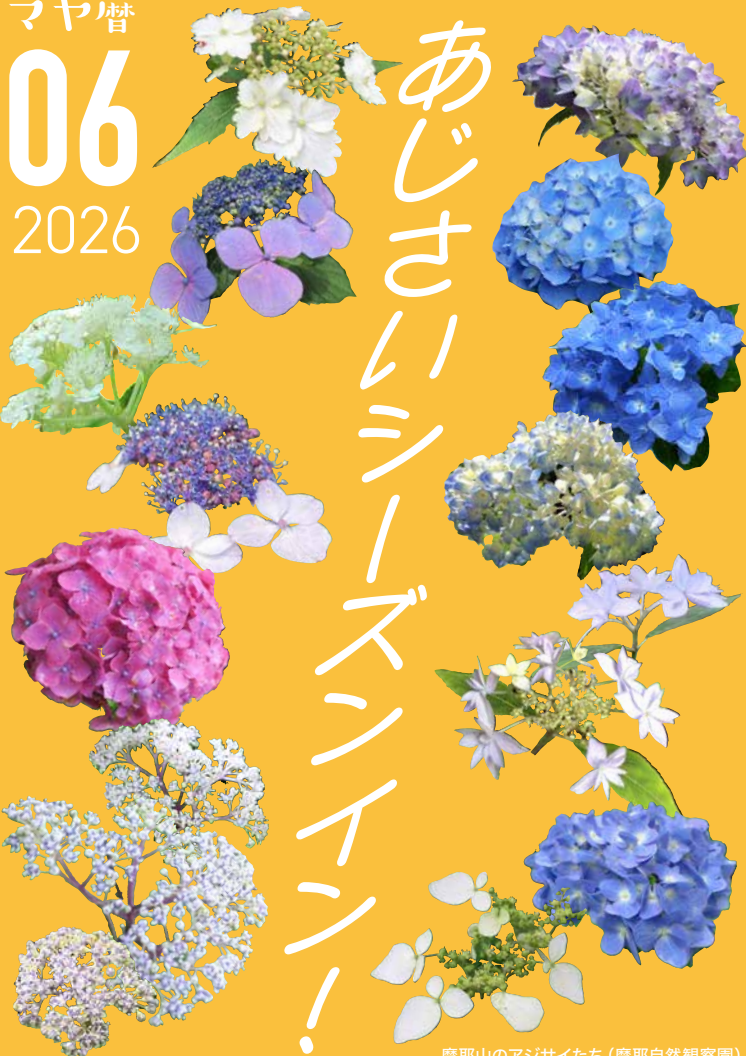
摩耶山のアジサイたち (摩耶自然観察園)