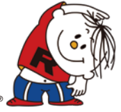
ラジオ体操イメージキャラクター ラタ坊®