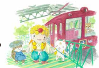
イラスト 殿本祐子

🎫 正会員 大人 5,000円 (子ども半額) 特典: まやビューライン有効期限内フリー乗車など