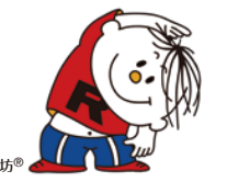
ラジオ体操イメージキャラクター ラタ坊®