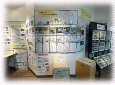
チョウのひみつやおもしろさがいっぱいの会場