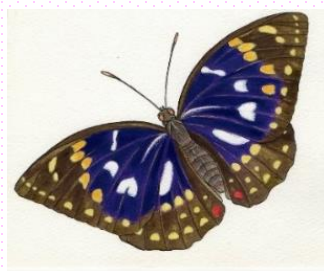
国蝶オオムラサキの減少率は10.4%/年 (画：わさび)